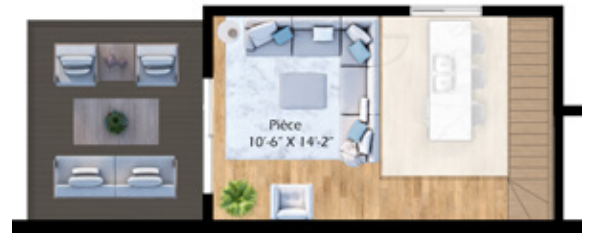
Mezzanine (177 pi 2 ) et terrasse privée sur le toit (175 pi 2 )